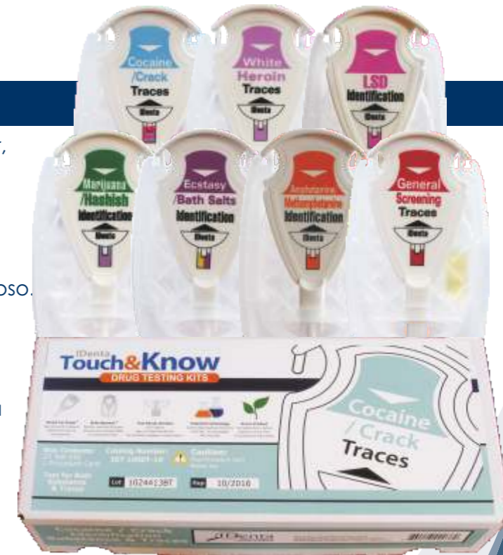
Caja de 10 kits

Cada unidad de prueba consiste en un tomador de muestras, hasta tres ampollas de vidrio rompibles y selladas herméticamente, y una cámara de reacción. Las ampollas contienen los productos químicos necesarios para realizar la prueba. No se requiere medir, mezclar o verter reactivos.